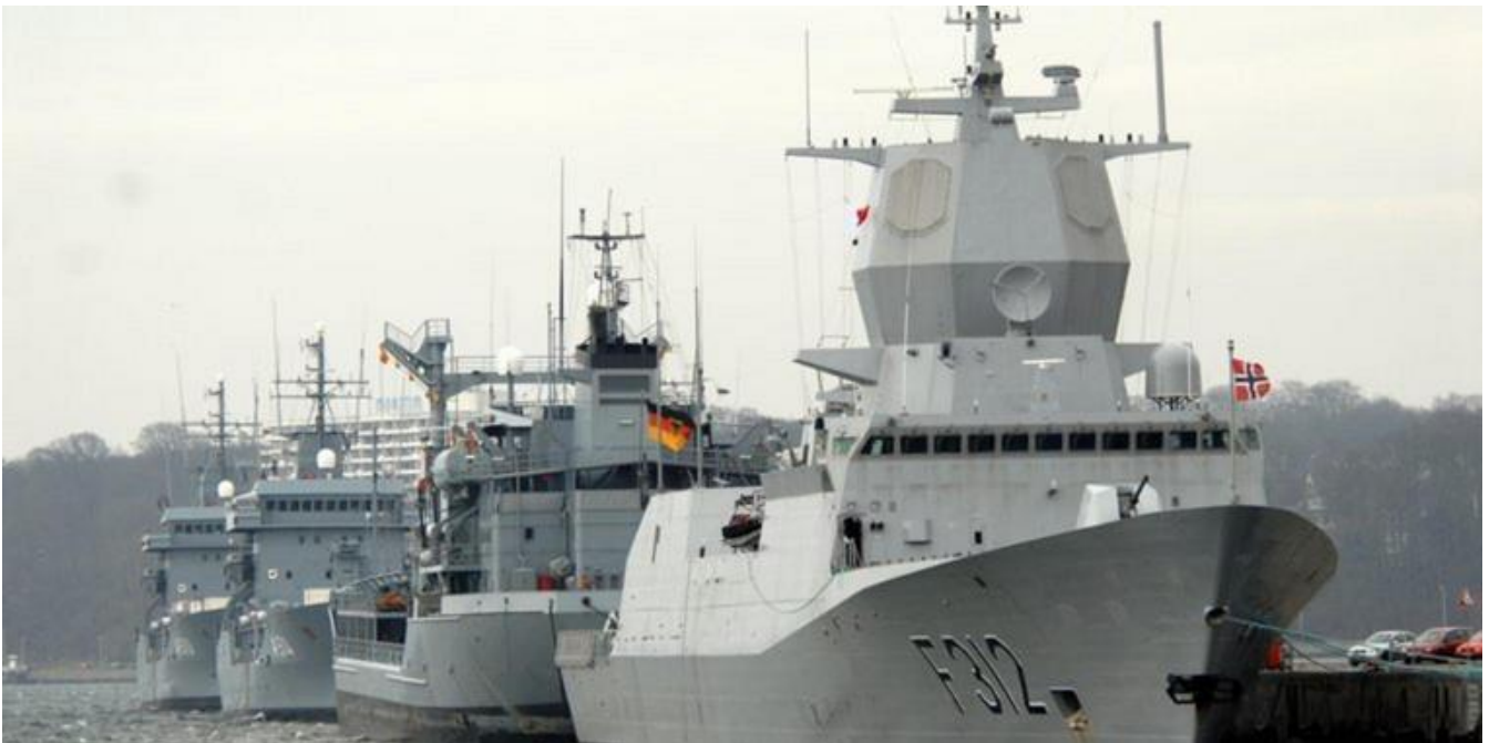
Einheiten vor dem Manöver BALTOPS an der Tirpitzmole in Kiel