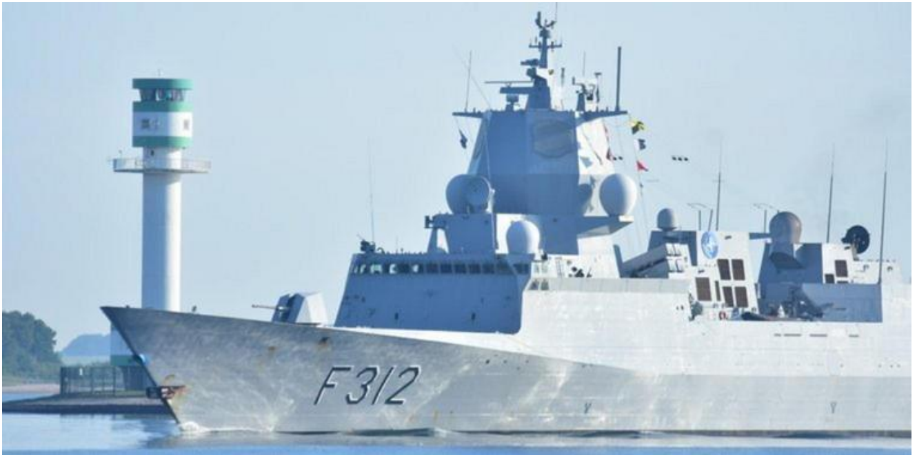
Die norwegische Fregatte OTTO SVERDRUP passiert den Leuchtturm Friedrichsort, einlaufend Kiel