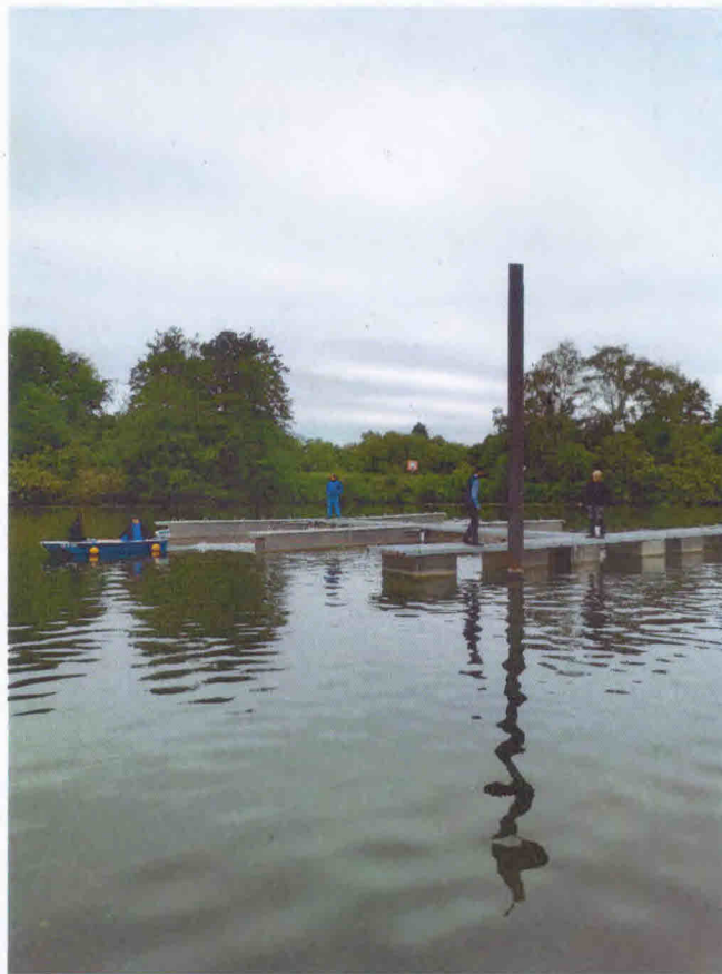
Die komplette Anlage wird zum Heimschiff „Aschaffenburg“ geschleppt