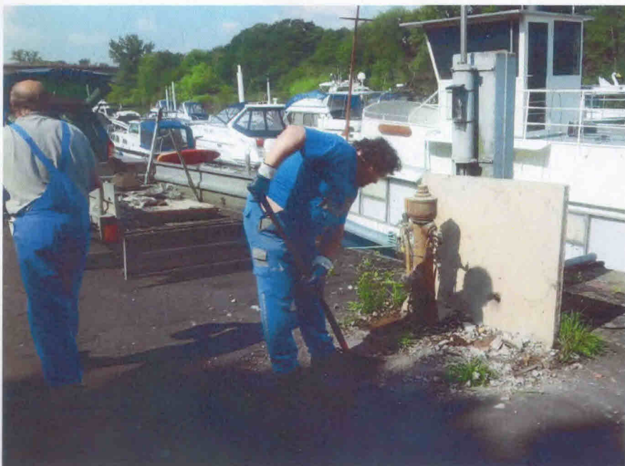
Die Aktion „Presslufthammer Bernhard, ratta zong weg ist der Beton!“