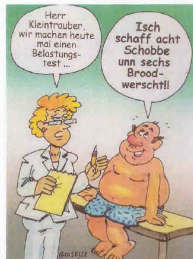
Und hier wie immer ein Cartoon aus dem San – Bereich.